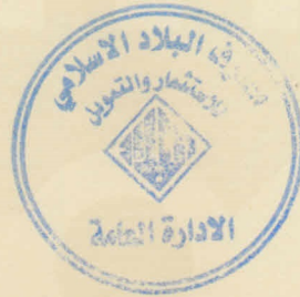
بسمة حامد محسن مديرة قسم الاستثمار