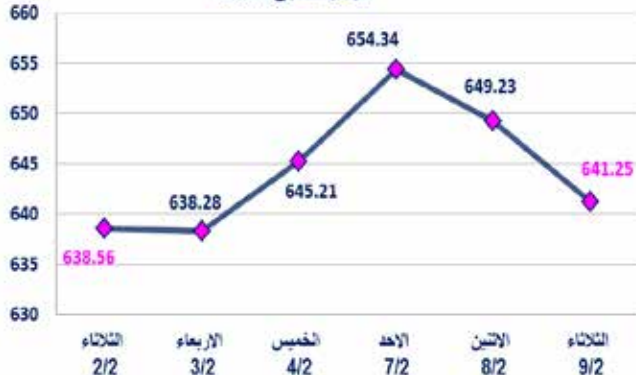
مؤشر السوق ISX60